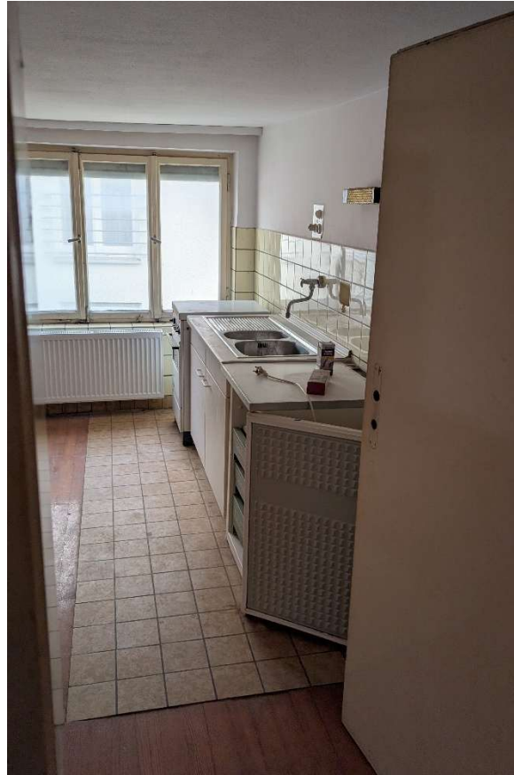
Küche 2. OG: