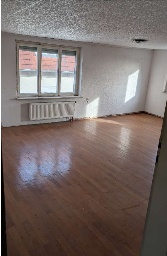
Zimmer 2. OG: